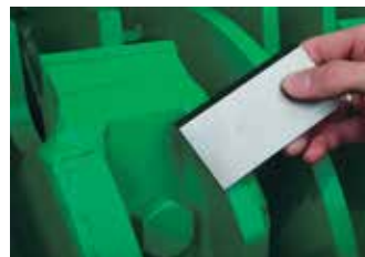
Rotor à couteaux à changement rapide.