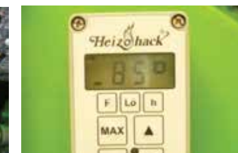
Système de commande HeizoHack HE 002 pour réguler l'avancée du bois à déchiqueter en fonction de la puissance d'entraînement.