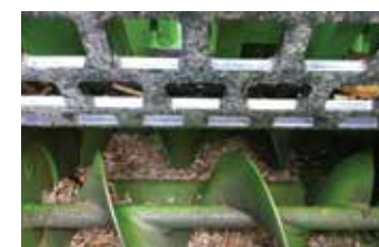
Grilles de calibrage interchangeables selon la taille de plaquettes souhaitée.