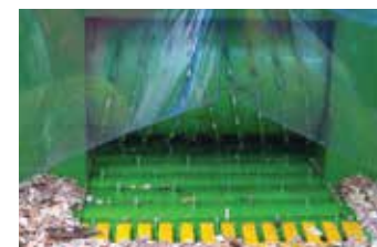
Système d'alimentation puissant rouleau et tapis ameneur en acier à dents d'entraînement soudées.