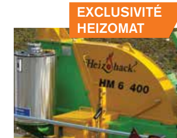
EXCLUSIVITÉ HEIZOMAT Soufflerie à volant d'inertie : . bonne éjection des plaquettes . réserve de puissance.