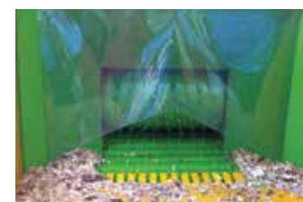
Système d'alimentation puissant rouleau et tapis ameneur en acier à dents d'entraînement soudées