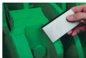
Rotor à couteaux à changement rapide

Soufflerie à volant d'inertie : . bonne éjection des plaquettes . réserve de puissance.