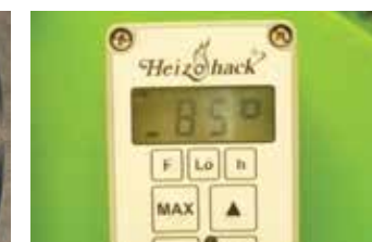
Système de commande no-stress Heizhack HE 002 pour réguler l'avancée du bois à déchiqueter en fonction de la puissance d'entraînement.