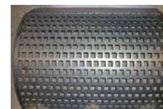
Grilles de calibrage interchangeables selon la taille de plaquettes souhaitée.