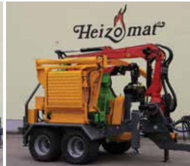
Tapis sur table d'alimentation en option